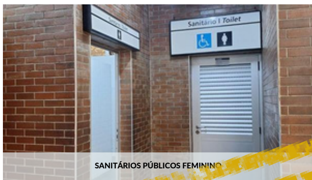
SANITÁRIOS PÚBLICOS FEMININO