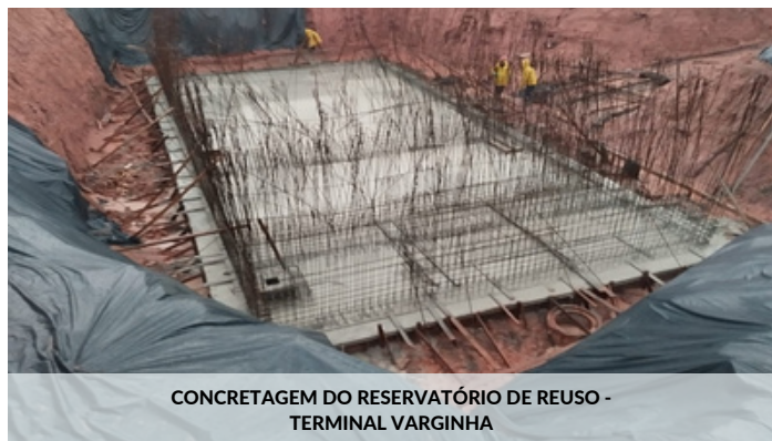
CONCRETAGEM DO RESERVATÓRIO DE REUSO - TERMINAL VARGINHA