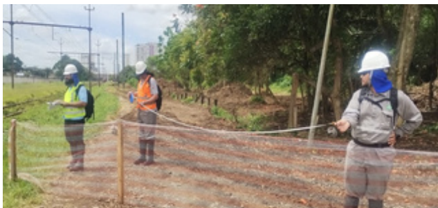
MEDIDAS DAS DISTÂNCIAS PARA O PLANO DE CORTE DAS CAIXAS DE CONEXÃO DERIVADAS DA SALA DE UTINGA (CBTC) LINHA 10