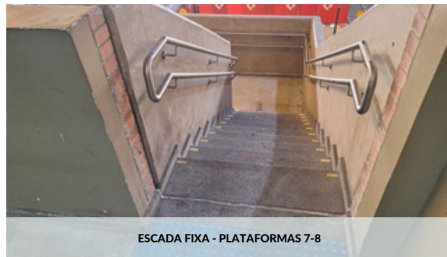
ESCADA FIXA - PLATAFORMAS 7-8