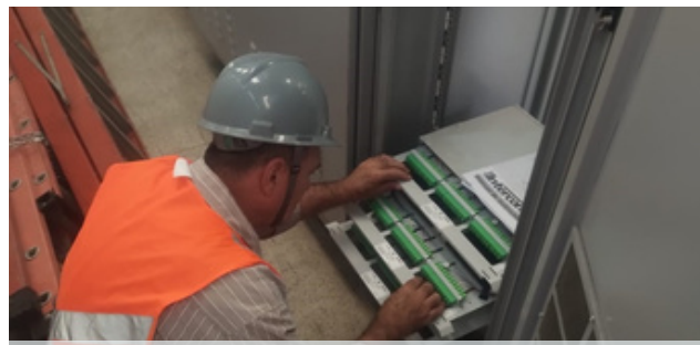
INSPEÇÃO DA INFRAESTRUTURA DO STO (SISTEMA DE TRANSMISSÃO ÓPTICO) NA CABINE SECCIONADORA DE IPIRANGA - LINHA 10