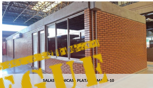
SALAS TÉCNICAS - PLATAFORMAS 9-10