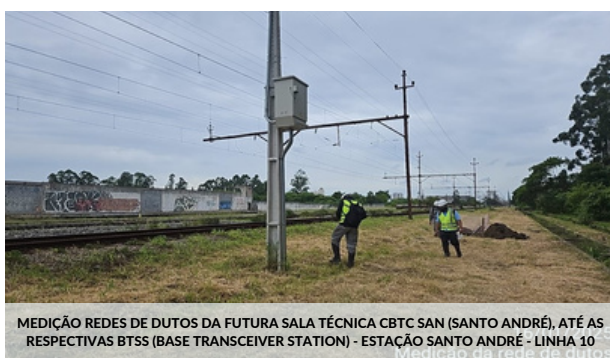
MEDIÇÃO REDES DE DUTOS DA FUTURA SALA TÉCNICA CBTC SAN (SANTO ANDRÉ), ATÉ AS RESPECTIVAS BTSS (BASE TRANSCIEVER STATION) - ESTAÇÃO SANTO ANDRÉ - LINHA 10