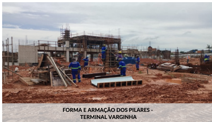
FORMA E ARMAÇÃO DOS PILARES - TERMINAL VARGINHA