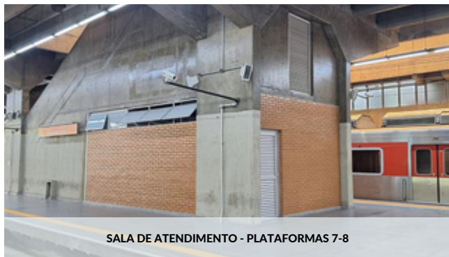
SALA DE ATENDIMENTO - PLATAFORMAS 7-8